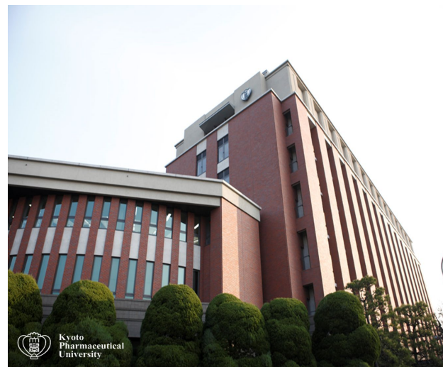
会場 愛学館 A31愛学ホール